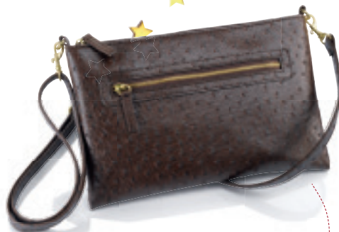
Torebka Diya PVC ze wzorem strusiej skóry, 16,5 cm x 26,2 cm, pasek: 75-134 cm, długość paska od ramienia do torebki: 32-62 cm 6967 4