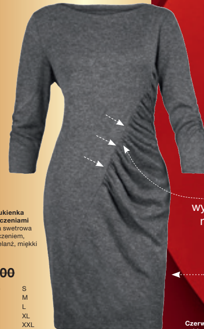
Szara sukienka z marszczeniami sukienka swetrowa z marszczeniem, szary melanż, miękki dżersej 6985 6