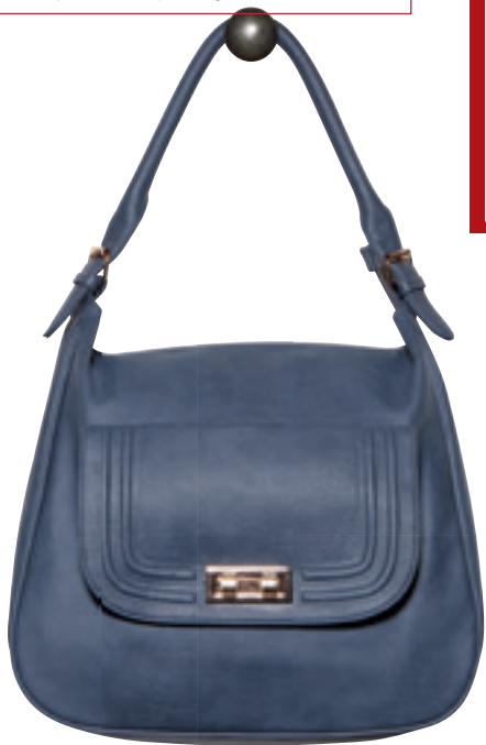
Torebka Madelyn PVC, 34 cm x 13 cm x 34 cm, wysokość rączki: 15,5 cm 6964 1

ZGRABNA I POJEMNA TORBA MIEJSKA sprawi, że cię zauważą. Naturalnie dopasowuje się do ramienia